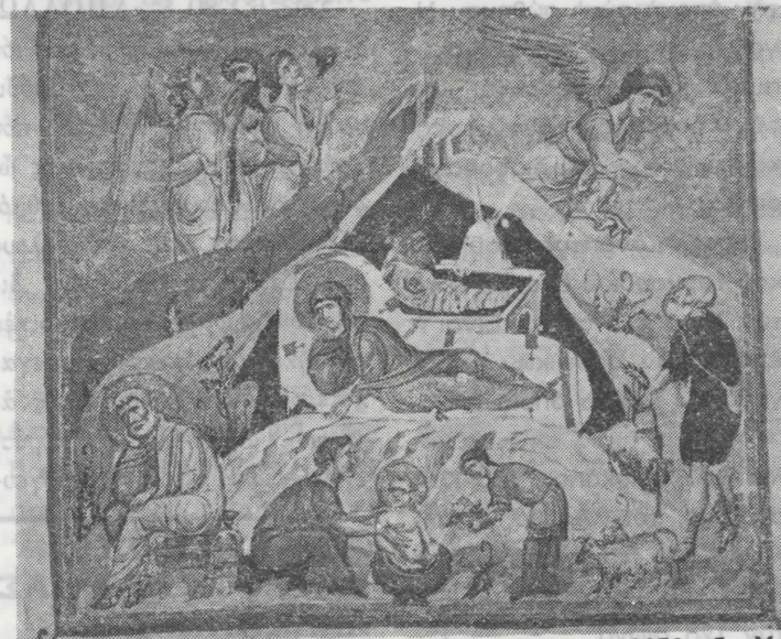
(Από το χειρόγραφο αριθ. 587 του έτους 1059 της Μονής Διονυσίου στο Άγιον Όρος).

Ο Βυζαντινός μικρογράφος, ακολουθεί τον παραδοσιακό τρόπο, απεικονίσεως του γεγονότος της Γεννήσεως του Ίησού, με την ανακλιμένη Θεοτόκο και το βρέφος στην κτιστή φάτνη. Το λουτρό του Ίησού - στο κάτω μέρος της εικόνας - το σπήλαιο και ο σκεπτικός Ίωσήφ άριστερά, είναι στοιχεία από τα «άποκρυφα» βιβλία της Καινής Διαθήκης, που έμειναν όμως μέσα στην εικονογραφία του γεγονότος. Εκτός από την εικονογραφία της σκηνής δεν μπορεί να περάσει απαραίτητη ή ικανότητα του καλλιτέχνη να οργανώσει σωστά τη σκηνή και ακόμη να επεξεργάζεται με ξεχωριστή δύναμη τις λεπτομέρειες των προσώπων και των ρούχων.