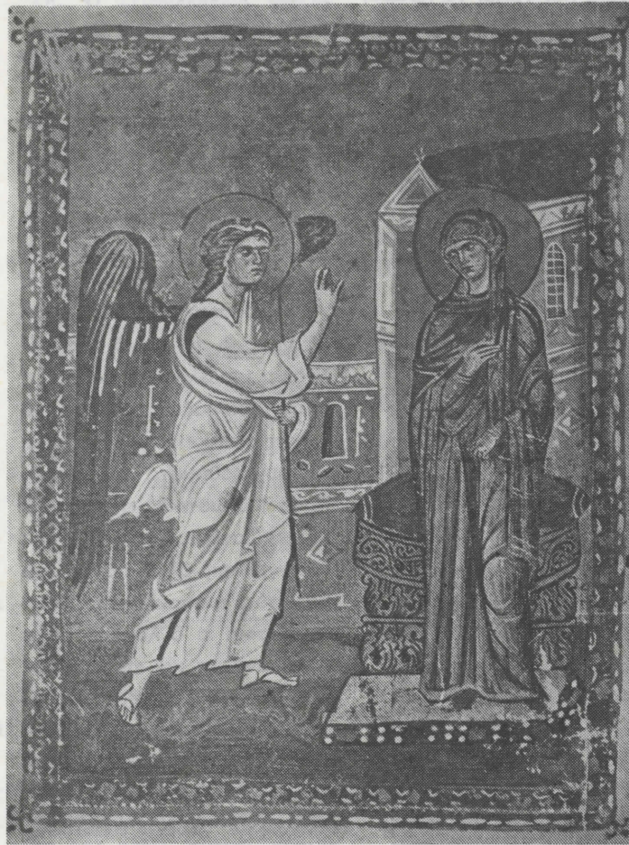
(Μικρογραφία από χειρόγραφο του 12ου αι. της Μονής Παντελεήμονος του Άγιου Όρους).

Σύμφωνα με την διήγηση του ευαγγελιστή Λουκά, ο άγγελος Γαβριήλ εμφανίστηκε κάποια στιγμή στην Παρθένο Μαρία ενώ βρισκόνταν στο σπίτι της. Η Θεοτόκος άκουσε τα παράξενα νέα, έγινε κάποια συζήτηση και ο άγγελος χάθηκε. Αυτή άκριβώς τή στιγμή εικονίζεται και ο ζωγράφος της παραπάνω εικόνας του χειρογράφου από την Μ. Παντελεήμονος. Μιὰ διακοσμησηκή ταινία περιορίζει τή σκηνή που ξετυλίγεται μπροστά σε οικοδομήματα. Ο άγγελος μόλις έφτασε από τον ουρανό και ή Παρθένος, θορυβημένη, σηκώνεται από το κάθισμα, σταματώντας το γέναιο, και άκούει τα χαρούμενα νέα του Ευαγγελισμού. Ο ζωγράφος, παρά το γεγονός ότι ακολουθεί πιστά τήν παράδοση τόσο στη σύνθεση όσο και στις λεπτομέρειες, καταφέρνει με το ταλέντο του να άποτυπώσει με δύναμη τήν μοναδική στιγμή της Ιστορίας του ανθρώπου.