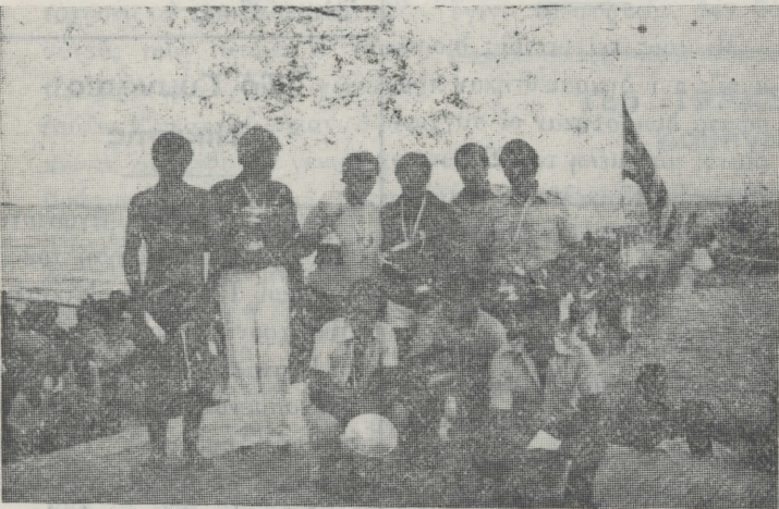
Οἱ ἐπτά κολυμβητὲς που τεμάτισαν στὸν 8ο Διάπλου με τούς Πρόεδρο και Γ. Γραμματέα τοῦ Σίθωνα

— Ἀπὸ τούς πρώτους στὸ χῶρο τῶν ἐπισημῶν εἶδαμε τὸν Νομαρχόντα Διευθυντὴ Νομαρχίας Χαλκιδικῆς κ. (Συνέχεια στὴ σελ. 6)