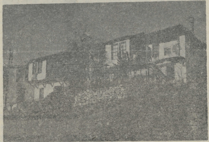
Λαϊκὴ ἀρχιτεκτονικὴ τῆς Νικίτης

Εὐχαριστοῦμε τὸν κ. Πρόεδρον γιὰ τὴν καλὴν διάθεσιν πὸν ἔδειξε σὲ νὰ συνεργασθῆ μαζί μας, νὰ μᾶς ἐνημερώσῃ πᾶν ὡς τὰ προβλήματα πὸν βασανίζουν τὴν κοινότητα, καὶ πιστεύομε ὅτι με τὸ δημοσίευμά μας θὰ βοηθήσομε ὅσον γίνεται περισσότερο ἐπὶ τὴν λύσιν τῶν προβλημάτων τῆς Οὐρανοῦπολης, προβλημάτων πὸν δημιουργεῖ ἡ ἀλόγιστη καὶ ἀσυνάρτητη ἐφαρμογὴ νόμων ἀπὸ ἀρμόδιους πὸν τόσο ξένοι εἶναι πρὸς τὶς ἰδιόρρυθμεις συνθήκες κάθε τόπου. Ἴσως τὰ ῥάξομε μὲ τὸν ὕπνον τῆς ἀδιαφορίας τους, συναισθανθοῦν τὴν ἀδυναμία τους καὶ ἐπιτρέψουν ἓνα ἐλεγχόμενον ἀποκεντρωτισμὸν.