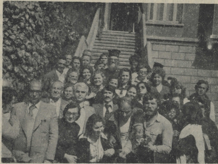
... και στό Πατριαρχείο

Η επίσκεψη στα Πριγκηπόννησα — Πρώτη, Χάλκη, Πρίγκηπο — μās γεμίζει με θλιβερές αναμνήσεις βλέποντας μιὰ Ελλάδα πού δέν ύπάρχει πιά. Όλα εκεί θυμίζουν και μιλούν μόνον τους ότι είναι Έλληνικά. Σπίτια, εκκλησίες, μοναστήρια, έξωκλήσια κ.λ.π. Τό μόνο πού λείπει οι Έλληνες πού κυνηγημένοι και κατατρεγμένοι από τήν Τουρκία, σιγά σιγά αφήνουν τὰ πάντα και έρχονται εδώ για μιὰ καλύτερη ζωή. Η Χάλκη ακόμα και σήμερα έχει Έλληνικό Γυμνάσιο. Είναι ένα τεράστιο συγκρότημα και έχει μιὰ από τίς μεγαλύτερες βιβλιοθήκες πού ύπάρ-