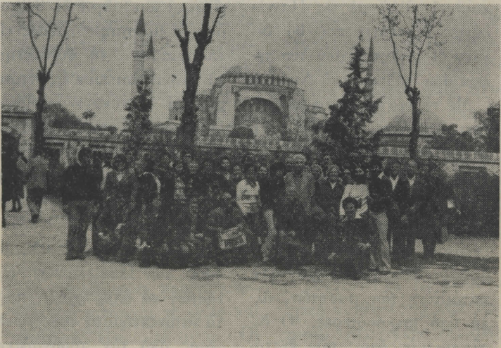
Στήν Αγία Σοφία...

Μέσα σε μιὰ φοριχτή άτμόσφαιρα σε ένα άπαίσιο περι-