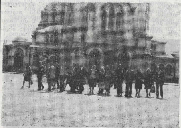
Ἀπὸ τὴν ἐκδρομὴ τοῦ «ΣΙΘΩΝΑ» στὴ Βουλγαρία