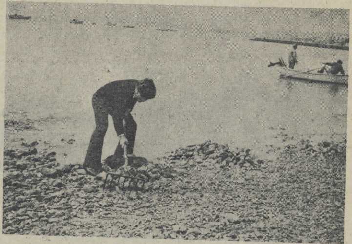
Καθαρισμὸς τῆς παραλίας

Δὲν ἔφτανε τῶν ἀνθρώπων ἡ νὰ περιποιηθῆ καὶ νὰ φυλάγεται. Πρέπει οἱ Νικητιανοὶ καὶ εἰ