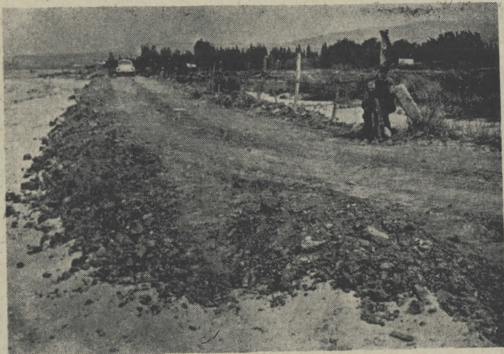
Κατασκευὴ δρόμου μὲ ἀποτέλεσμα ἐξασφάλιση τῆς ἄμμου

Στοιχεῖο πρῶτο: Περιπατώντας τὴν ἀκτὴ ἀμέσως ἔξω ἀπ' τὴ Νικήτη πρὸς τὸ Μαριμαρά, βλέπουμε οἰκόπεδα, πολὺ πάνω ἀπὸ 4 στρέμματα (τὸ ὄριο γιὰ νὰ κτίσει κανεὶς) ἢ καὶ ἤδη κτισμένα, νὰ ἔχουν ἐπεκταθεῖ πολὺ μέσα στὴν αἰγιαλιτιδα ζώνη. Καὶ ἂν ἀκόμη δὲν ἐπεκτάθηκαν, φρόντισαν οἱ ἰδιοκτῆτες τους νὰ κατασκευάσουν δρόμο μὲ ἐπιχωματώσεις πάνω στὴν ἄμμο, σὲ βάρος τῆς αἰγιαλιτιδας ζώνης. Ἀναρωτήθηκαν ἄραγε οἱ ἰδιοκτῆτες ἂν χάνουν ἢ κερδίζουν μ' αὐτὸ τὸν τρόπο; Γιατὶ χῶρια ἀπ' τὴ παρανομία ποῦ εἶναι διώξιμη καὶ καταγγέλλουμε στὴν ἀρμόδια ἰπηρεσία, ὑπάρχει καὶ ἡ οὐσία: Ὁφελήθηκαν οἱ ἰδιοκτῆτες μὲ τὸ νὰ μειώσουν τὴν ζώνη τῆς (Συνέχεια εἰς τὴν σελ. 7)