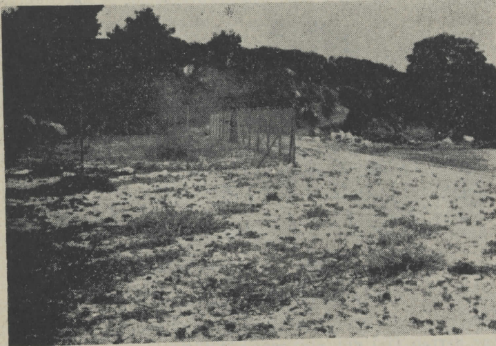
Το οικόπεδο του Διευθυντού της Δ.Ε.Η.

άμμου από τα 30 μ. στα 20 ή στα 25 μ.; Αν ήθελαν δρόμο, μπορούσαν να διαθέσουν 5 μ. από το οικόπεδό τους. Δεν ζημίωσαν θέβαια έλλατώνοντας το βάθος από τα 150 μ. στα 145 μ. Και ο δρόμος θα τους άνηκε. Άλλωστε το οικόπεδο, δεν μετράει πλέον με τα μέτρα του — δεν πρόκειται να πουληθεί — ούτε και έπηρεάζει το μέγιστο ποσοστό κάλυψης. Το