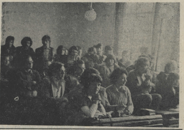
Κόπηκε μὲ μεγάλη ἐπιτυχία στὴ Θεσσαλονίκῃ.