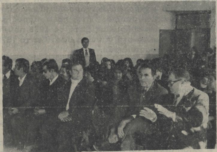
Στιγμιότυπο από τήν τελετή τής βράβευσής των μαθητών

γνωστάρας ο οποίος έδωσε και τις χρηματικές άμοιβές, και ή τελετή έκλεισε με τήν ύπόσχεση του Σίθωνα για χρηματικά έπαθλα και στους μαθητές του Δημοτικού. Πρέ- πει να τονίσουμε ότι ή μεγά- λη άξία των ύποτροφιών συ- νίσταται στην δημιουργία μιās εύγενούς ανταγωνιστι- κής άμιλλας μεταξύ των μαθη- τών ή όποία αποβλέπει στην εμπέδωση μέσα στη σφαίρα τής ύψηλότερης επίδοσης και τής μαθήσεως γενικότερα.