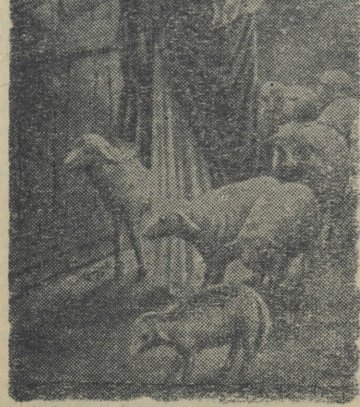
Η ΣΤΗΛΗ ΤΟΥ ΧΡΙΣΤΙΑΝΟΥ

Ο αγαπών Εύθυμιαν, θέλει κατασταθή πένης. Ο αγαπών οίνον δεν θέλει πλουτίσει.