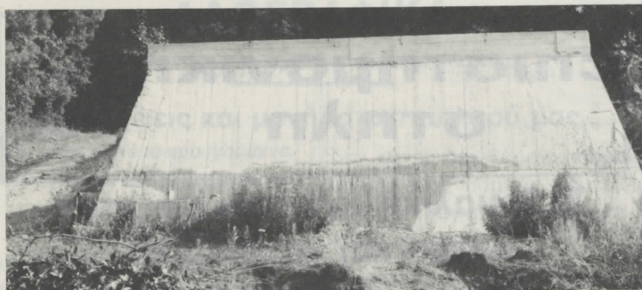
Υδατοδεξαμενή 75 κ.μ. για την συγκέντρωση νερού κατάσβεσης πυρκαγιών στη θέση «Μάννα» Γοματίου.

Το Δασαρχείο Αρναίας είναι η μεγαλύτερη δημόσια περιφερειακή Υπηρεσία του Νομού Χαλκιδικής. Η περιοχή του Δασαρχείου καταλαμβάνει έκταση 761.200 στρέμματα που κατανέμονται ανάλογα με τη μορφή εδαφοπονικής εκμετάλλευσης ως εξής: