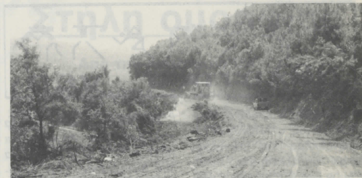
Διάνοιξη αντιπυρικής ζώνης στις αναδασώσεις Στρατονίκης.

Το Δασαρχείο Αρναίας σε συνεργασία με τον Κυνηγτικό Σύλλογο Αρναίας έχει ιδρύσει 6 καταφύγια θηραμάτων συνολικής εκτάσεως 200.000 στρεμμάτων. Επίσης έχει συντάξει και υλοποιεί μελέτη βελτίωσης των συνθηκών διαβίωσης των ενδημικών