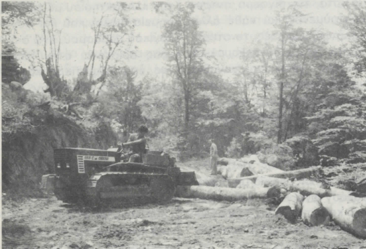
Μετατόπιση στρόγγυλης ξυλείας - οξυάς.