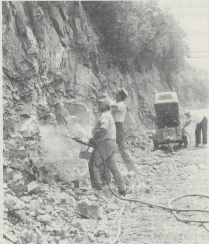
Διάτρηση βράχων κατά την διάνοιξη δασικής οδού Στρατονίκη - Παρεκλήσι Αγ. Νικολάου.