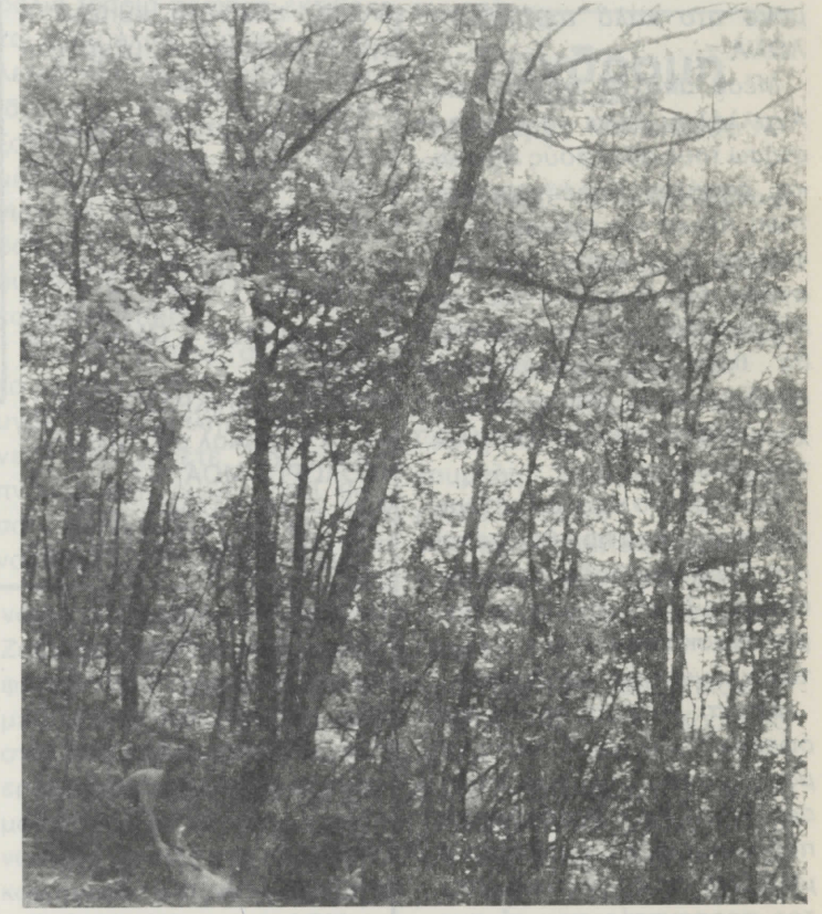
Αποφιλωτική υλοτομία Δρυός για κάλυψη ατομικών αναγκών κατοίκων Αρναίας.