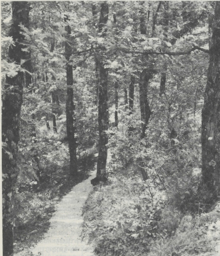
Σκυροστρωμένο μονοπάτι αναψυχής σε δρυοδάος περιοχής Βαρβάρας.