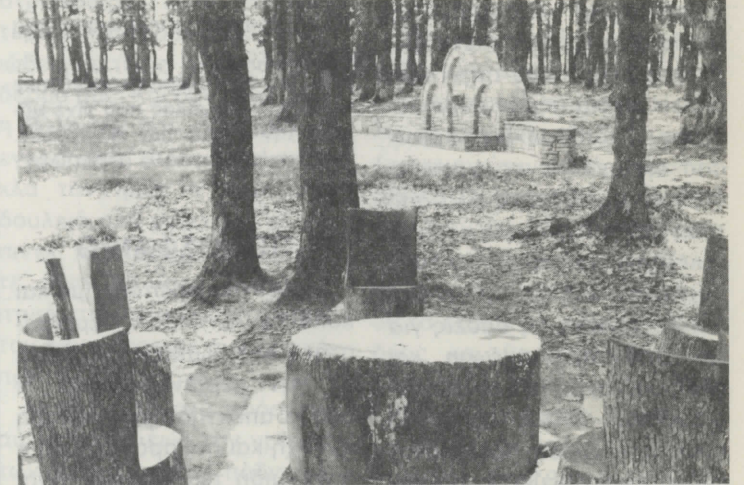
Τμήμα Χώρου δασικής αναψυχής Αγία Παρασκευή - Αρναία.