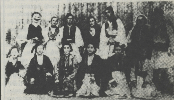
Οι ηθοποιοί και οι ηθοποιήτριες της Αρναίας, που έλαβαν μέρος εις την θεατρική παράστασιν, περί της οποίας γράφομεν εις την άνω σελίδα.