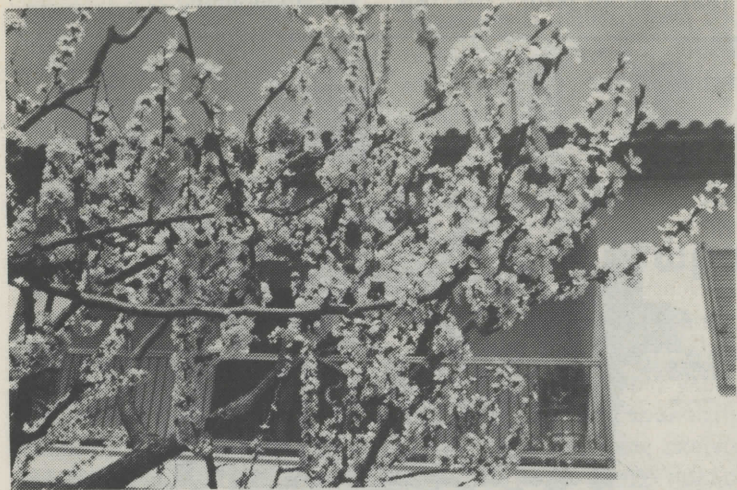
Ανθι σμένη αμυγδαλιά την άνοιξη στην Αρναία

Τα χρόνια βέβαια αλλάξαν. Η χελιδόνα συνεχίζεται μα τα παιδιά δεν φοράνε πλέον τον «Μάρτη».