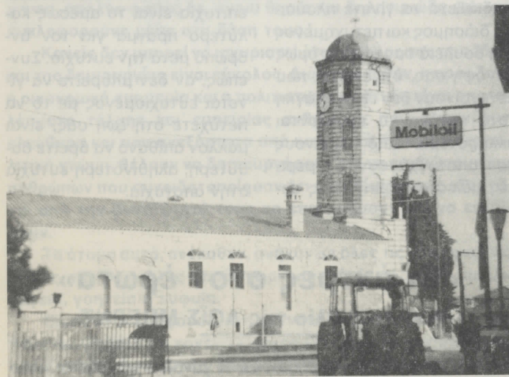
Το παλιό σχολειό (Νέο Δημαρχείο) και το Αρχοντικό του Γιατρού (νυν Κατσαγγέλου) όπως είναι σήμερα.

630 74 Αρναία Χαλκιδικής ή στο τηλ. 0372-22.049 6-8 μ.μ. κάθε μέρα εκτός Κυριακής.