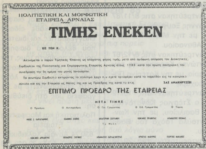
Ο τιμητικός έπαινος που η Πολιτιστική Εταιρεία θα απονείμει στους επίτιμους προέδρους.

ΑΓ. ΣΟΦΙΑΣ 24 (4ος όροφος) ΘΕΣΣΑΛΟΝΙΚΗ ΤΗΛ. ΙΑΤΡΕΙΟΥ: 277.538, ΟΙΚΙΑΣ: 942.161