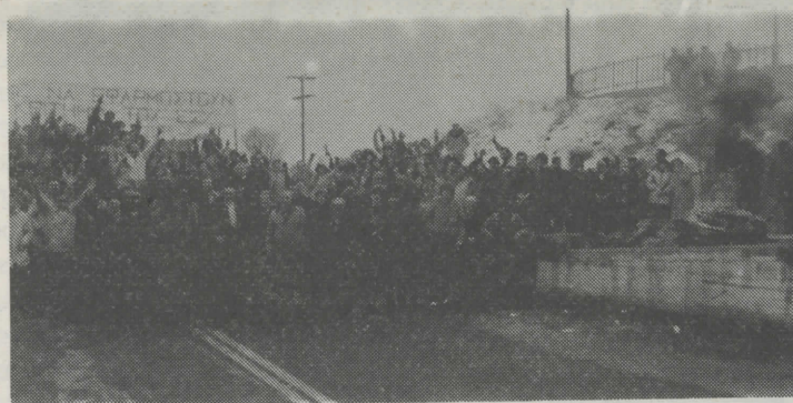
Δημοσιεύουμε χωρίς σχόλια το παρακάτω κείμενο που γράφηκε στις 18/1/85 στην εφημερίδα Ελευθεροτυπία.

Απογευματινή: «Ηφαίστειο» η Χαλκιδική για ένα Κέντρο Υγείας» Έχουν αναστατωθεί χιλιάδες κάτοικοι.