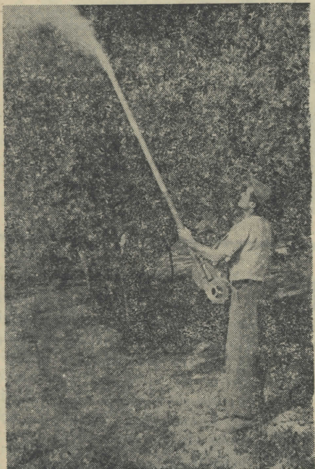
(Ἐκ τῆς Δ)νσεως Γεωργίας Νομοῦ Χαλκιδικῆς)

Νὰ ἡ ἐποχὴ γιὰ τὸ πρῶτον σκόνισμα ἢ ψεκασμός. Τὰ μπουμπουκία τῶν τσαμπιῶν ἔχουν ξεχωρίσει καλὰ τὸ ἕνα ἀπὸ τὸ ἄλλο χωρὶς ἀκόμα νὰ ἔχουν ἀνοίξει, θειαφίστε μὲ σκόνη 10 ο)ο. Ντρί-Ντρί-Τί. Ἄν σὰς βολεύει ἀντὶ νὰ θειαφίστε ὁραντίστε μὲ Ντρί-Ντρί-Τί 50 ο)ο. Μετὰ 7 μέρες θειαφίστε μὲ τὴν ἴδια σκόνη ἢ ξαναφαντίστε.