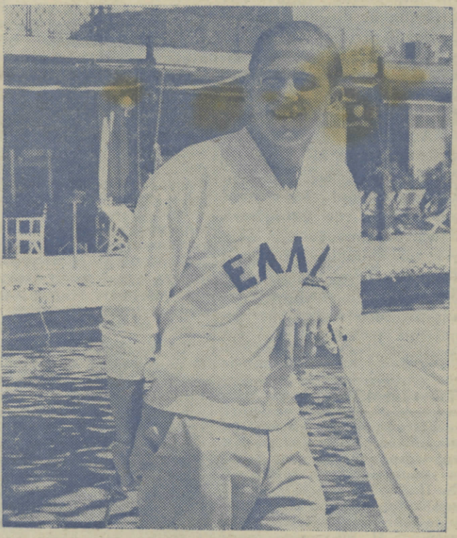
Ἡ Α.Υ. ὁ Ὀλυμπιονίκης Διάδοχος ΚΩΝΣΤΑΝΤΙΝΟΣ

λύτως τὰς ἐνθουσιώδεις ἐκδηλώσεις τοῦ Ἑλληνικοῦ Λαοῦ, τὸν ὁποῖον ἡ καρδιά του οὐδέποτε τὸν ἀπατᾷ. Ἀπροσμετρήτου βαθύτητος καὶ ἀσυγκρίτου μεγαλείου εἶναι τὸ γεγονός. Οὐδεμία ἐπιτυχία τῶν μεγάλων κρατῶν, ὡς αἱ Ἡνωμένα Πολιτεῖαι καὶ ἡ Ρωσία. Οὔτε αἱ ἑκατοντάδες τῶν βαθμῶν καὶ ὁ μέγας ἀριθμὸς τῶν μεταλλίων, τὰ ὁποῖα ἐκέρδησαν αὐτὰ. Οὔτε αἱ καταπληκτικαὶ ἐπιδόσεις τῶν ἀθλητῶν των εἰς τοὺς Ὀλυμπιακοὺς Ἀγῶνας τῆς Ῥώμης δύναται νὰ παραβληθῶσι πρὸς τὸ ὑπέροχον γεγονός τῆς λαμπρᾶς μας νίκης. Διότι τὴν νίκην αὐτὴν τὴν ἐκέρδησεν ὁ Πρῶτος Νεὸς τῆς Ἑλλάδος. Καὶ τὴν ἐκέρδησεν εἰς τὴν θάλασσαν εἰς τὴν ὁποῖαν πάντοτε, ἀπὸ τῆς ἐν Σαλαμίνοι ναυμαχίας καὶ μέχρι σήμερον μόνον τὴν νίκην καὶ τὴν δόξαν ἐγγώρισεν