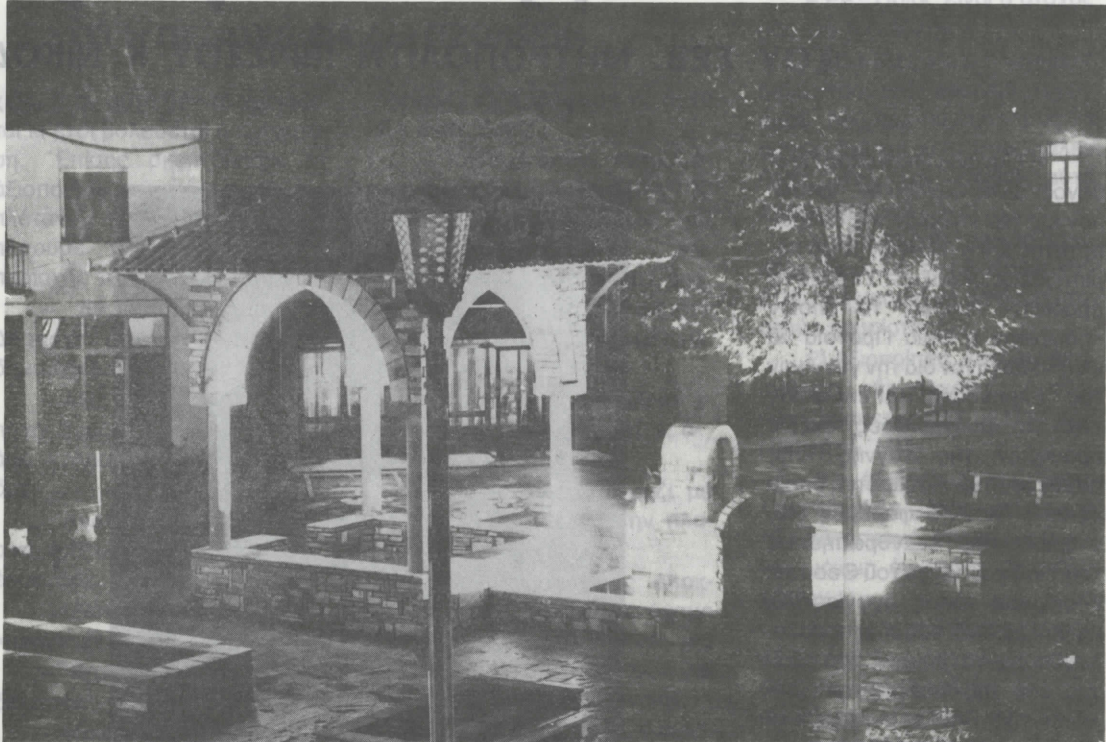
Νυχτερινή άποψη της πλατείας του Παλαιοχωρίου. Διακρίνονται τό κιάσκι, ή κρήνη και τά παραδοσιακά φανάρια.

Έτσι, όπως μάς πληροφορήσε ο βουλευτής κ. ΚΩΝ. ΤΣΙΟΥΠΛΑΚΗΣ, με προσωπικές του έντονες ενέργειες έγκρίθηκαν, από τό Υπουργείο Χωροταξίας Οικισμού και Περιβάλλοντος, οι παρακάτω πιστώσεις, για τήν κατασκευή και διαμόρφωση πλατειών και χώρων πρασίνου σε διάφορους Δήμους και Κοινότητες του Νομού, όπως: 1. Δήμοι: - Πολυγύρου: 5 έκατ. δρχ. - Ίερισσού: 600 χιλ. δρχ. - Κασσάνδρας: 500 χιλ δρχ. - Αρναίας: 500 χιλ δρχ. 2. Κοινότητες: - Γαλάτιστας: 500 χιλ δρχ. - Βραστάμων: 300 χιλ δρχ. - Ν. Ρόδων: 200χιλ. δρχ.