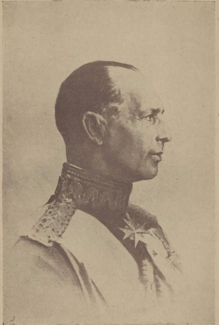
Η Α. Μ. Ο ΒΑΣΙΛΕΥΣ ΤΩΝ ΕΛΛΗΝΩΝ ΓΕΩΡΓΙΟΣ Ο Β΄