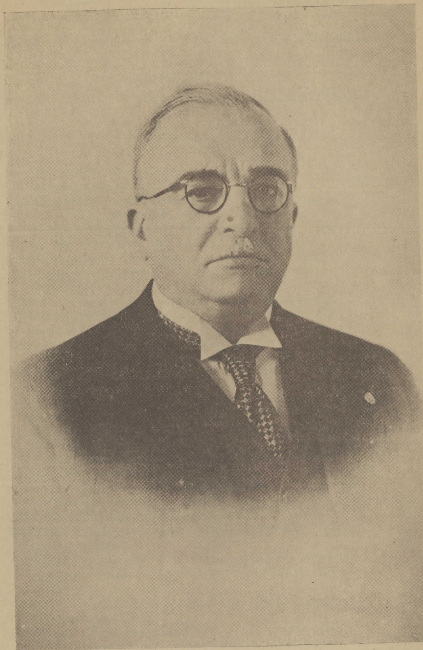
Η Α. Ε. Ο ΠΡΟΕΔΡΟΣ ΤΗΣ ΚΥΒΕΡΝΗΣΕΩΣ Κ. ΙΩΑΝΝΗΣ ΜΕΤΑΞΑΣ