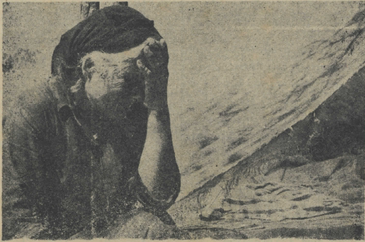
Προσφυγιά: Μία ακόμα άνοιχτή πληγή του Κυπριακού

Ἡ de facto κατάσταση και ἡ ἐπιμονή τῆς Έλληνικῆς Κυβέρνησης νὰ μείνει τὸ Κυπριακό μέσα στὰ πλαίσια και τὰ