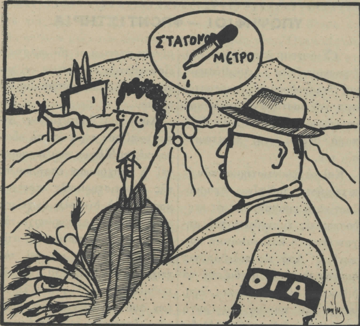
— Και θάχεις για τα γεράματα μια γερή σύνταξη!

Αυτή λοιπόν είναι ή άληθινή ιστορία. Κι' όσο κι' άν τή διαστρεβλώνει το Ύπουργείο, οί μαθητές θα τή μάθουν.