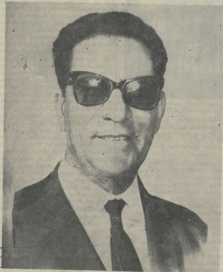
Ο ΓΕΝΙΚΟΣ ΓΡΑΜΜΑΤΕΥΣ ΑΘΛΗΤΙΣΜΟΥ Κος ΚΩΝΣΤΑΝΤΙΝΟΣ ΑΣΛΑΝΙΔΗΣ