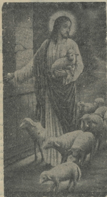
Η ΣΤΗΛΗ ΤΟΥ ΧΡΙΣΤΙΑΝΟΥ