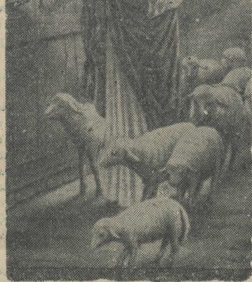
Η ΣΤΗΛΗ ΤΟΥ ΧΡΙΣΤΙΑΝΟΥ

“Όστις έμφράττει τὰ ότα αυτού εις την κραυγήν του πτωχού θέλει φωνάξει και αυτός, και δεν θέλει εισακουσθή.