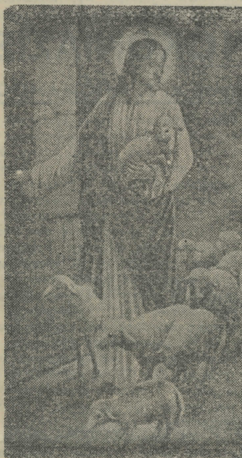
Η ΣΤΗΛΗ ΤΟΥ ΧΡΙΣΤΙΑΝΟΥ

ΔΟΚΙΜΑΣΑΤΕ Τὰ έκλεκτά Προϊόντα του Έργοστασίου Γάλακτος τῆς Ένώσεως Γεωργικῶν Συνεταιρισμῶν Χαλκιδικῆς ΓΡΑΒΙΕΡΑ ΦΟΝΤΙΝΑ ΠΡΟΒΟΛΟΝΕ ΤΕΛΕΜΕΣ ΒΟΥΤΥΡΟΝ ΚΡΕΜΑ ΕΝΩΣΙΣ ΓΕΩΡΓΙΚΩΝ ΣΥΝΕΤΑΙΡΙΣΜΩΝ