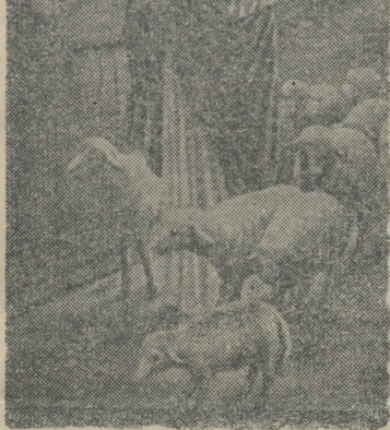
Η ΣΤΗΛΗ ΤΟΥ ΧΡΙΣΤΙΑΝΟΥ

Τί να διαβάσετε, από την Παλαιά Διαθήκη, και Καινή Διαθήκη, σε ώριμες περιστάσεις.