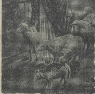
Η ΣΤΗΛΗ ΤΟΥ ΧΡΙΣΤΙΑΝΟΥ

ΓΝΩΜΕΣ ΜΕΓΑΛΩΝ ΑΝΔΡΩΝ ΙΩΑΝΝΗΣ ΧΡΥΣΟΣΤΟΜΟΣ