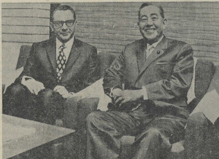
Ο Ίάπων Πρωθυπουργός κ. Σάτο, μετά τοῦ συμπατριῶτου μας (έκ μητρὸς) Ὑπουργοῦ Έμπορικῆς Ναυτιλίας, Καθηγητοῦ κ. Ιωάννου Χολέβα, κατά τήν πρόσφατον μετάβασιν αὐτοῦ εις Ίαπωνίαν, εις τὸ πρόσωπον τοῦ Ὁποίου ή Έθνικὴ Έπανάστασις ένεπιστεῦθη τὸν ζωτικώτατον τούτον τομέα τής χώρας μας ὅπου μεγαλουργεί.

Έπομένως και ὅταν πονούμε, συνεπεία τῶν σφαλμάτων πού κάνομε στη ζωή μας, δέν πρέπει να τὰ χάνωμεν. Να άπογοητευόμεθα. Άλλά να διδασκώμεθα. Και υπό τὸ φῶς τῶν θεϊων δωρεῶν αὐτῶν τήν μνήμην και τήν συνείδησιν, να γινώμεθα ὄλο και καλύτεροι.