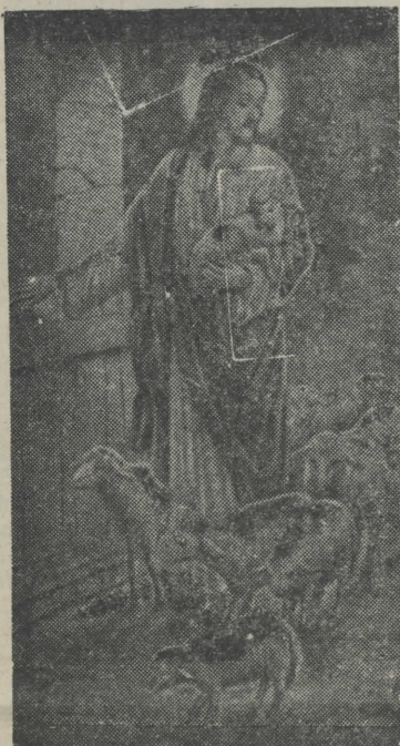
Η ΣΤΗΛΗ ΤΟΥ ΧΡΙΣΤΙΑΝΟΥ

ΤΟ ΤΗΛΕΦΩΝΟΝ ΤΗΣ ΕΦΗΜΕΡΙΔΟΣ ΕΙΝΑΙ: 522-539