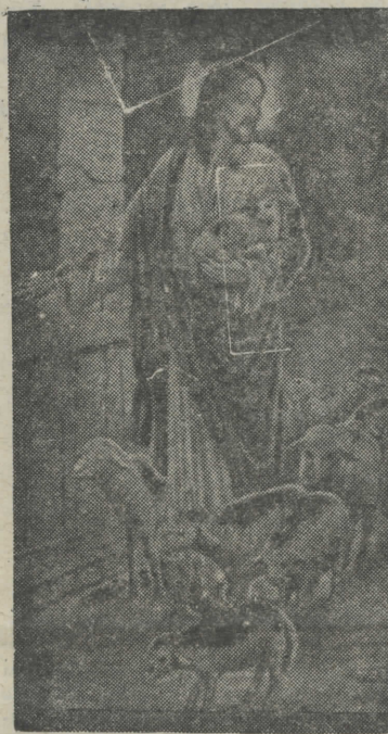
Η ΣΤΗΛΗ ΤΟΥ ΧΡΙΣΤΙΑΝΟΥ

Τὰ ἐμβάσματά σας εἰς τὴν κ. ΦΕ- ΡΕΝΙΚΗΝ Γ. ΓΕΩΡΓΟΥΔΗ, ὁδὸς Κα- νάρη 17 τοῦ Δήμου Συκεῶν ΘΕΣΣΑΛΟΝΙΚΗΝ ΤΟ ΤΗΛΕΦΩΝΟΝ ΤΗΣ ΕΦΗΜΕΡΙΔΟΣ ΕΙΝΑΙ: 522-539