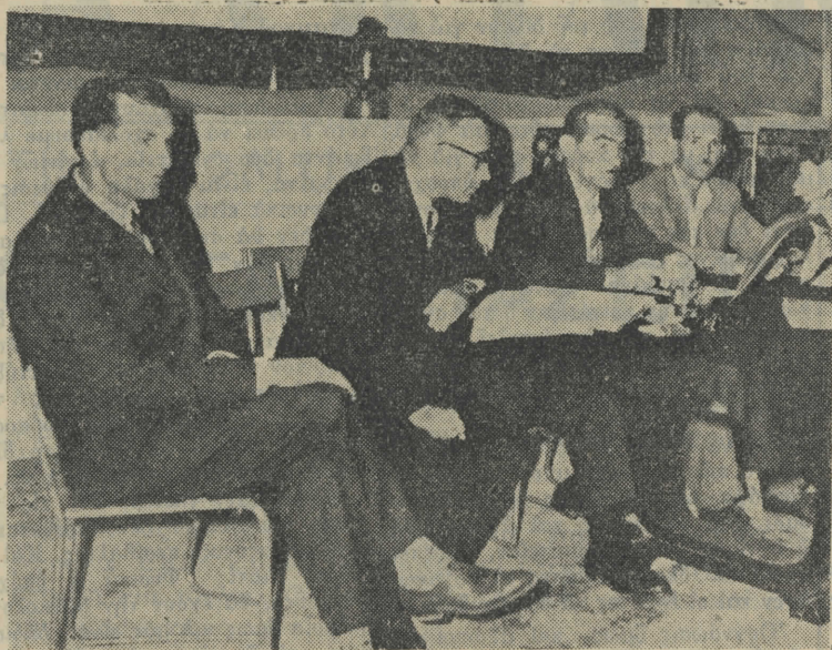
ΑΠΟ ΤΗ ΓΕΝ. ΣΥΝΕΔΡΕΥΣΗ ΤΗΣ ΕΝΩΣΕΩΣ ΓΕΩΡΓΙΚΩΝ ΣΥΝΕΣΜΩΝ ΧΑΛΚΙΔΙΚΗΣ

Ἐναν πολίτη τὸν κατεδίκαναν σὲ θάνατο καὶ τὸν πατᾶ μὲ ἄλλους δὺς - τρεῖς πολῖτες, σὲ εἰρκτῆ, γιὰτι πο-