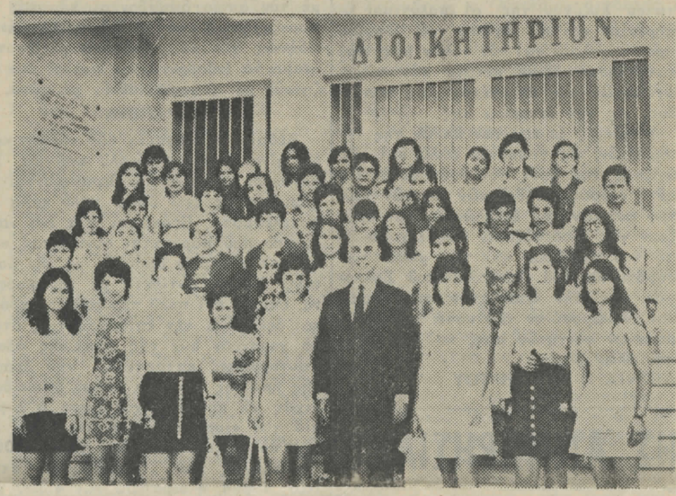
Ο Νομάρχης μας κ. Άνδρέας Κανελλόπουλος έν τώ μέσω των έκδρομέων άγροτονεαίδων μας.

καθ' όλα πολύτιμοι, ξενακα των όποιων και της έν γένει πολιτισμένης προς όλους συμπεριφοράς των, τους συνοδεύομεν και εις την νέαν των θέσιν με όλην την αγάπην μας και τας καλύτερας εύχάς μας δι' αυτούς και τας οικογενείας των.