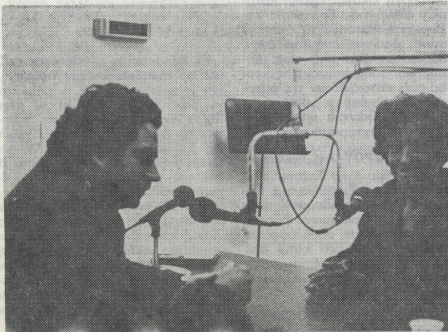
Από ραδιοφωνική συνέντευξη (σε στούντιο) για τη Χαλκιδική, το Άγιο Όρος και ασφαλώς για το έργο της Λαογραφικής Εταιρείας Χαλκιδικής (Σικάγο)