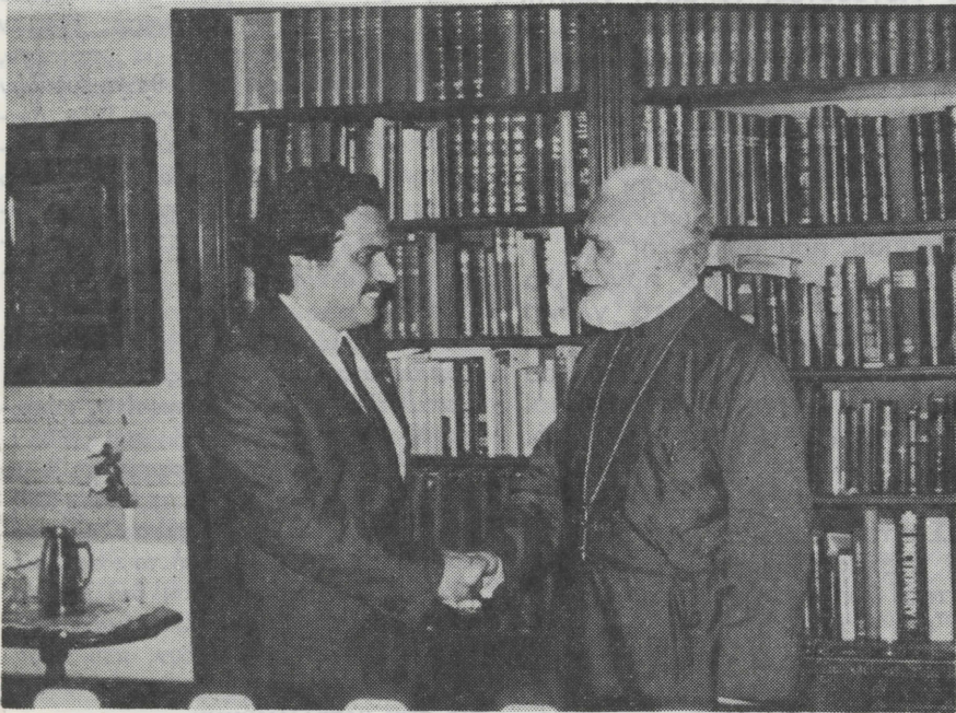
Ο κ. Βασ. Πάππας με τον Αρχιεπίσκοπο Βορείου και Νοτίου Αμερικής κ. Ιάκωβο, που τον υποδέχθηκε στο Γραφείο του με εγκάρδιότητα (Νέα Υόρκη)

Εμείς οι Χαλκιδικιώτες της Αθήνας, ο Σύλλογός μας, η εφημερίδα μας, όλοι πιστεύουμε οι Χαλκιδικιώτες, δεν έχουμε παρά να τον συγχαρούμε για την πρωτοβουλία του και για τα λαμπρά αποτελέσματά του που είναι τιμή