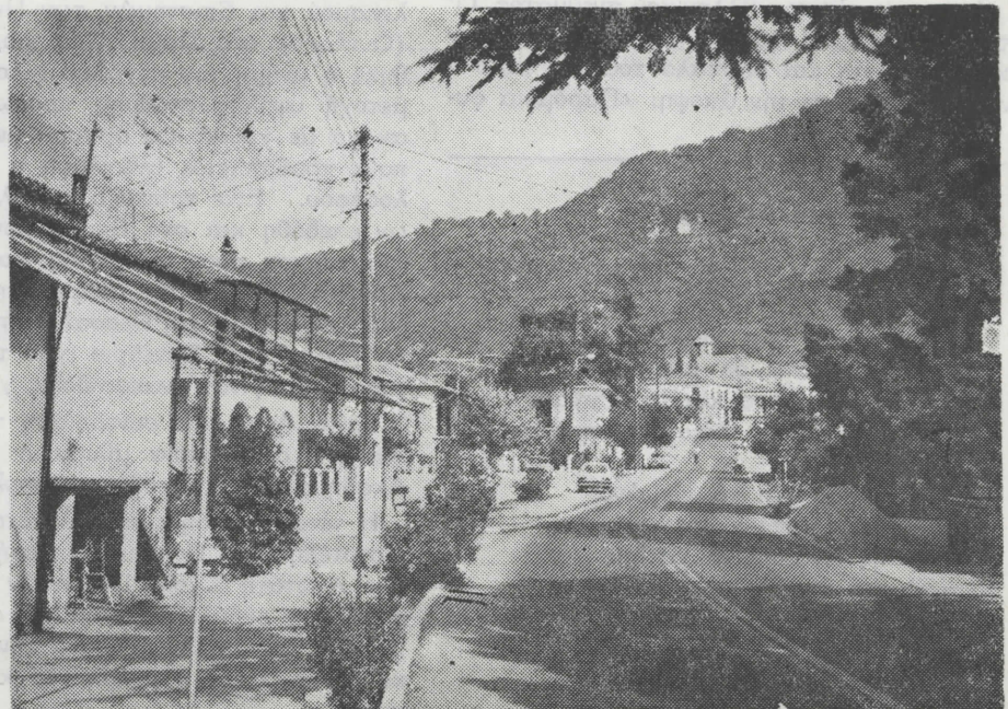
Κεντρικός δρόμος Στρατονίκης