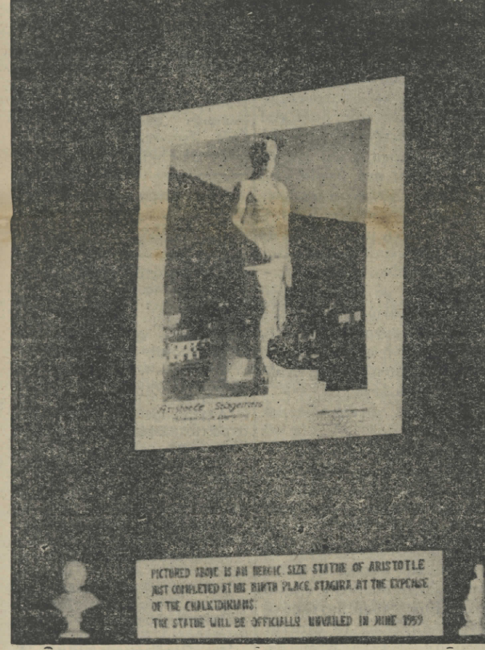
PICTURED ABOVE IS AN HEIK SIZE STATUE OF ARISTOTLE JUST COMPLETED AT HIS BIRTH PLACE, STAGIRA AT THE EXPENSE OF THE CHALKIDHIANS. THE STATUE WILL BE OFFICIALLY UNVEILED IN JUNE 1959

Η χώρα μας είναι μικρή. Στα μάτια όμως των ξένων