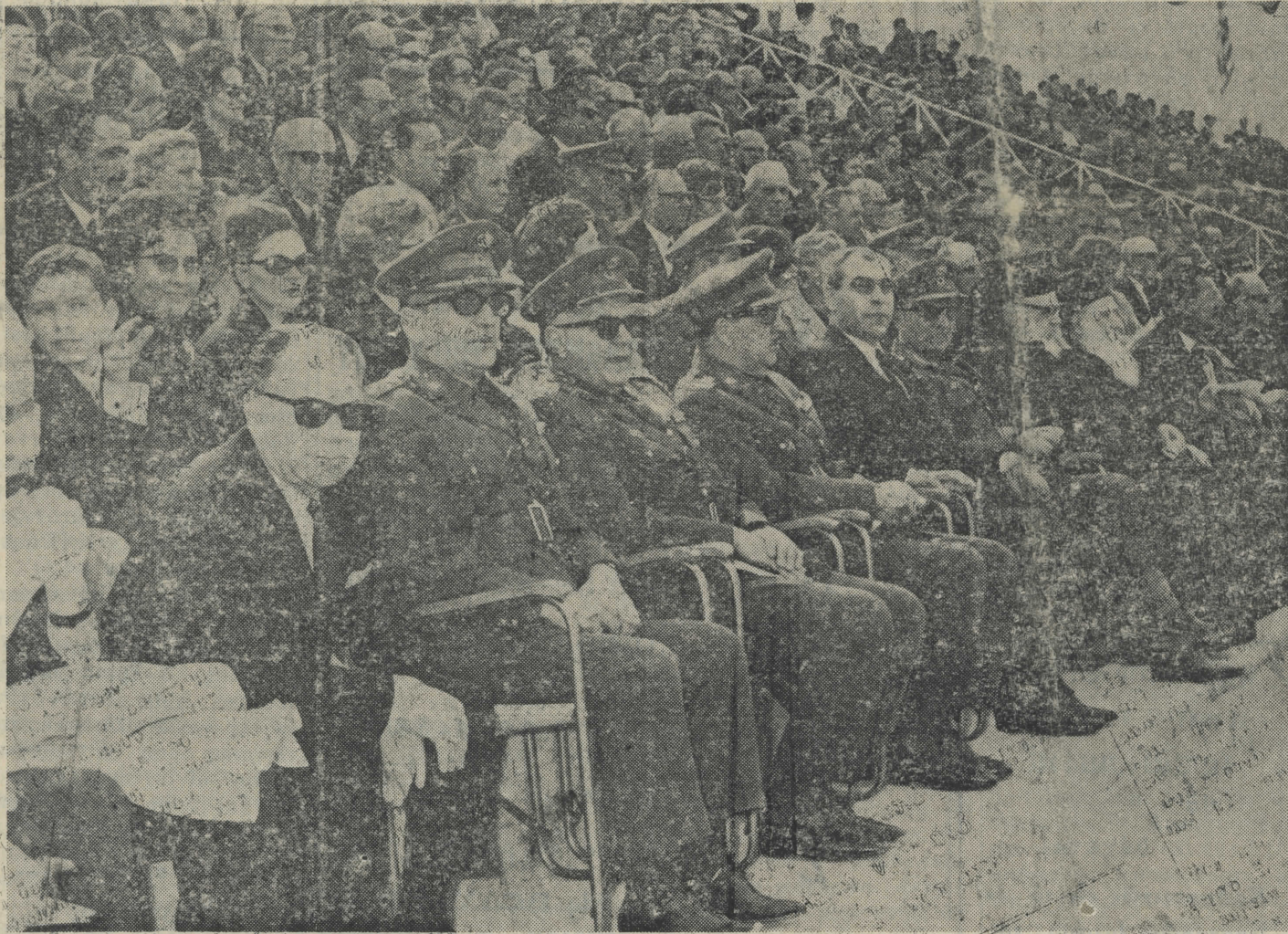
Απεψις τμήματος των κερκίδων του - σταδίου με τους παρακολούθησαντες εκδηλώσεις επίσημους

ΑΠΟ ΤΟΝ ΕΟΡΤΑΣΜΟΝ ΤΗΣ 21ης ΑΠΡΙΛΙΟΥ ΕΙΣ ΤΟ ΕΘΝΙΚΟΝ ΣΤΑΔΙΟΝ ΠΟΛΥΓΥΡΟΥ