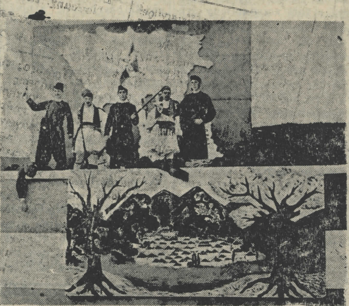
Τό άρμα τής εποχής των άγώνων τής Χαλκίης δια την άπελευθέρωσιν από τον Τουρκικόν ζυγόν