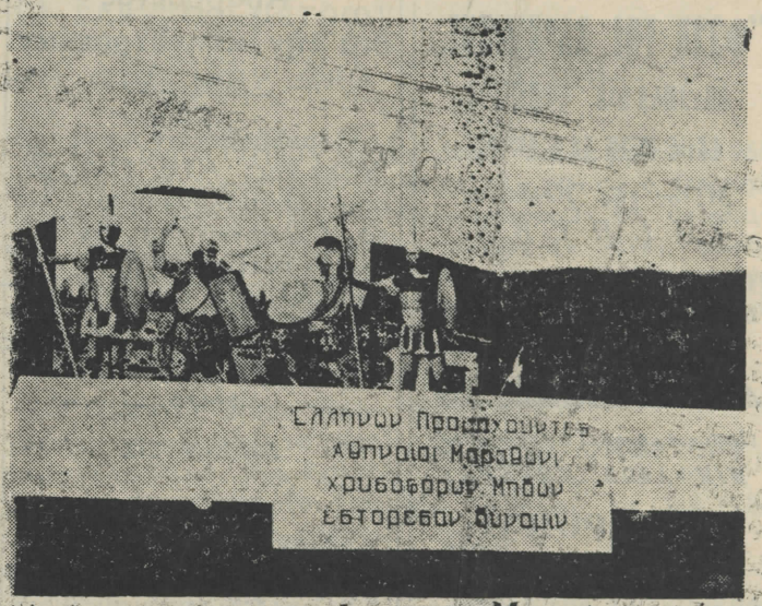
Ελληνων Προπαγουντες Αθηναϊοι Μαραθωνι χροδοφορον Ηπδων έβτορεσαν δύναμιν